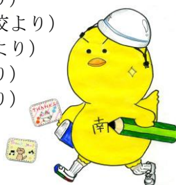
菖蒲南中キャラクター「ナンビー」