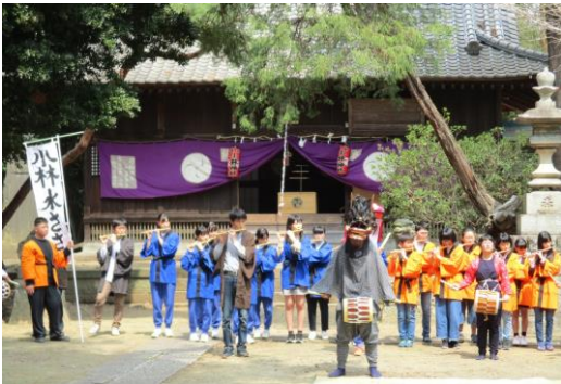
小林の水ささら 4月7日(日) 小林神社ささら奉納に、小林小学校の児童と共に、本校の生徒が参加しました。