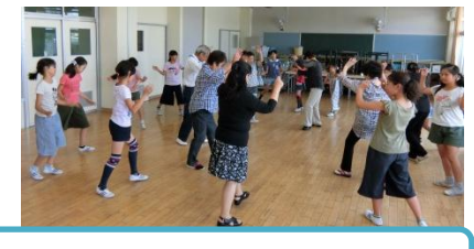
6/19栗くりゆうゆうプラザ開講