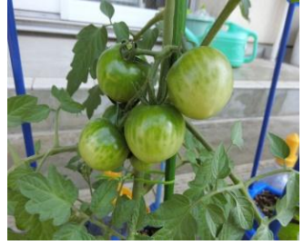
2年生のミニトマト

「根のある草は 芽をふく みずから伸びる 花を開く」 「根の深さと広がり が 樹の高さと広がりになる」 「根ぐされ病ほど恐ろしい病気はない 根を腐らせては すべてが水の泡だ」 「根気 根性 性根 それが人間を決定する」